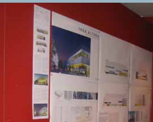
Ausstellung der Entwürfe im Stadtmodell.

Im Stadtteil löste der Siegerentwurf gemischte Reaktionen aus. Neben zahlreichen wohlwollenden Stimmen gab es auch eher zurückhaltende und kritische Anmerkungen. So wurde z.B. von Seiten der Bezirkspolitik eine größere Transparenz des Einrichtungshauses gefordert. Insbesondere die Gestaltung der Fassade zum Lawaetzweg genüge nicht den An-