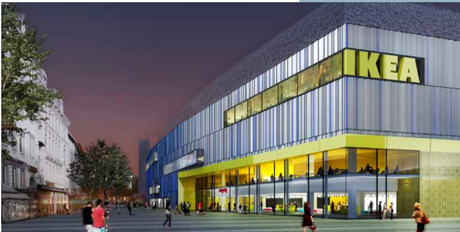
Siegerentwurf des IKEA-Fassadenwettbewerbs.