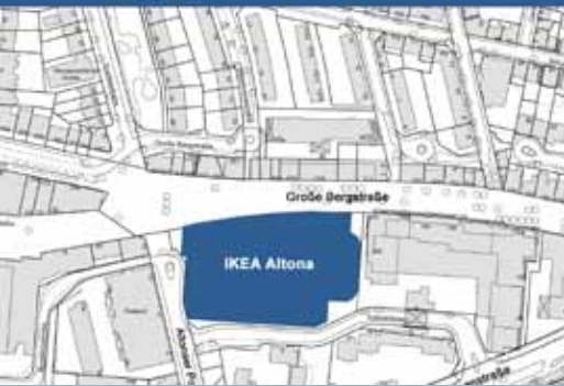
Lageplan IKEA Altona

Die Entscheidung ist gefallen. Nachdem die Jury des IKEA-Fassadenwettbewerbes am 2. Dezember 2010 drei der sechs eingereichten Architektenentwürfe in die engere Auswahl genommen und weitere Verbesserungen gefordert hatte, kürte Sie am 8. Februar 2011 den Entwurf des Architekturbüros „Dinse Feest Zurl“ zum Gewinner. Vorausgegangen waren Diskussionen unter den verschiedenen Mitgliedern der elfköpfigen Jury sowie den eingeladenen sachverständigen Beraterinnen und Beratern. Die Entscheidung fiel schließlich mit 8 zu 3 Stimmen für den Entwurf der Ottenser Architekten. Den zweiten Platz belegte der Entwurf des Architekturbüros „nps Tchoban Voss“. Der Fassadenentwurf des Büros „blauraum“ wurde von der Jury mit dem dritten Preis ausgezeichnet.