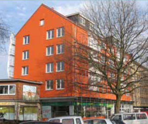
Nobistor 40 nach der Fassadensanierung.

Im Erdgeschoss wurde der Eingangsbereich neu geordnet und die Fläche des Lebensmittelgeschäfts in zwei Mieteinheiten aufgeteilt. Die beiden Einzelhandelsflächen wurden mit einer neuen, modernen Schaufensterfront ausgestattet. Während die Umgestaltung des rechten Ladengeschäftes bereits abgeschlossen wurde und sich die Räumlichkeiten in einem attraktiven, modernen Gewand zeigen, werden die Flächen des türkischen Supermarktes derzeit noch umfangreich modernisiert.