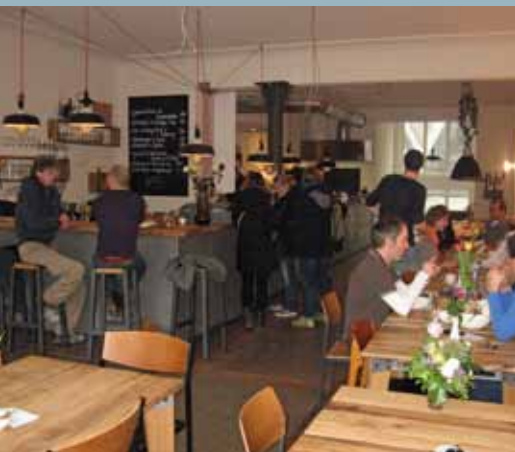
Das "Klippkroog" in der Großen Bergstraße 255.

Klippkroog Große Bergstraße 255 Montag bis Samstag: 8:00-18:00 Uhr Sonntag: 9:00 – 18:00 Uhr