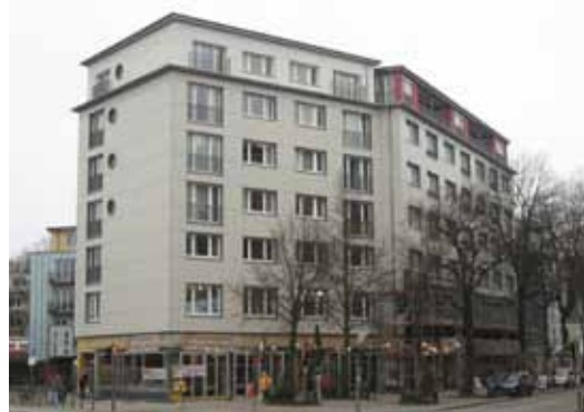
Eckgebäude Große Bergstraße/Max-Brauer-Allee.