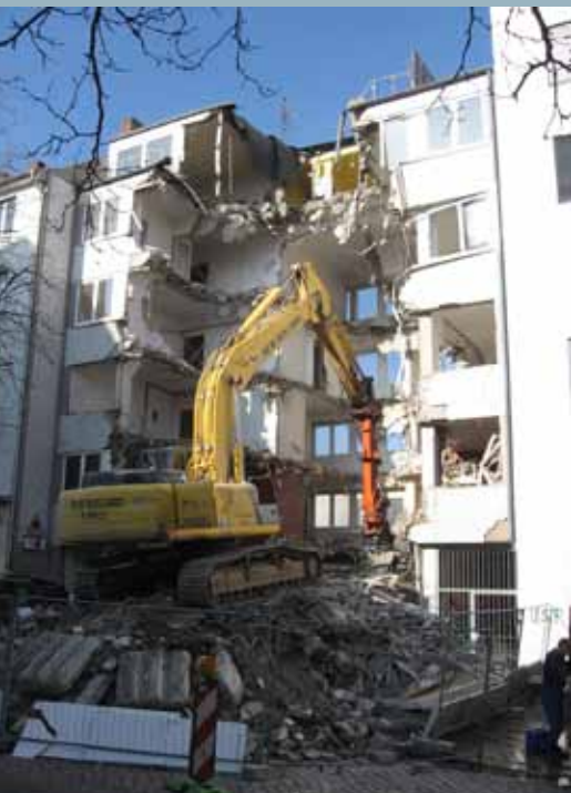
Abrissarbeiten am Nobistor 30.

Die Alevitische Gemeinde Hamburg (HAKM) hat ihren Sitz aus der Goethestraße in das ehemalige Sparkassengebäude Nobistor 33-35 verlegt. Das HAKM hat 350 Mitglieder und ist die Interessensvertretung der über 30.000 Aleviten in der Hansestadt. Die Aleviten sind eine Glaubensgemeinschaft, die ihren Ursprung in Anatolien hat und über Jahrhunderte wegen ihres nicht orthodoxen Glaubens verfolgt wurde. Der Verein hat sich zum Ziel gesetzt, Zu- und Einwanderern zu gesellschaftlicher und politischer Gleichstellung zu verhelfen und ihnen bei gesellschaftlichen und strukturellen Problemen Hilfestellungen anzubieten.