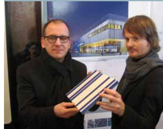
Architekten des Büros "Dinse Feest Zurl" mit einem Modell der Lamellen.