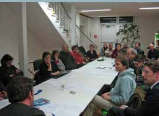
Beiratssitzung im treffpunkt.altona.