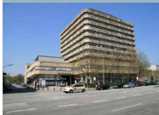
Der Altbau der ENDO-Klinik im Jahre 2007.

Am 1. Januar 2011 ist der Internationale Kinderladen aus der Blücherstraße mit den Kindern aus zehn Nationen und den mehrsprachigen Erzieherinnen in das Neue Forum gezogen. In dem Kinderladen ist auf 450 Quadratmetern Platz für 60 Kinder von sechs Monaten bis zum Schulalter. Eltern und Kinder, die sich den Internationalen Kinderladen anschauen möchten, sind immer donnerstags von 15:30 Uhr bis 16:30 Uhr willkommen.