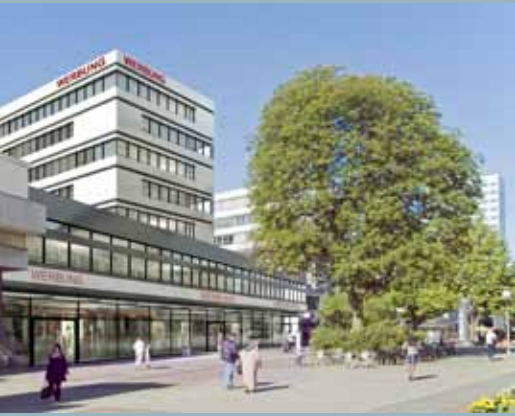
So soll das Gebäude Schillerstraße 44 nach der Sanierung aussehen.