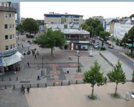
Der so genannte Goetheplatz soll attraktiver gestaltet werden.