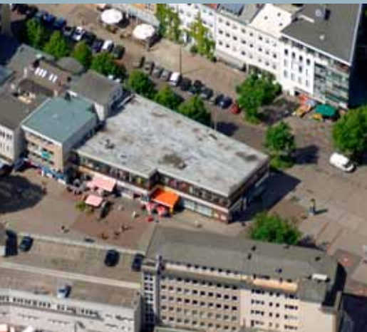
Neue Große Bergstraße 15 (Aufnahme 2007).