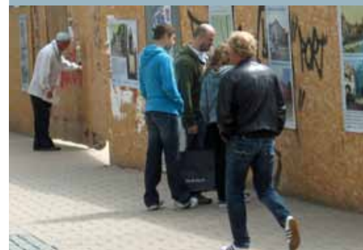
Altona in Variationen: Die Ausstellung am Bauzaun.