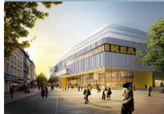
Zukünftige Ansicht aus der Großen Bergstraße.