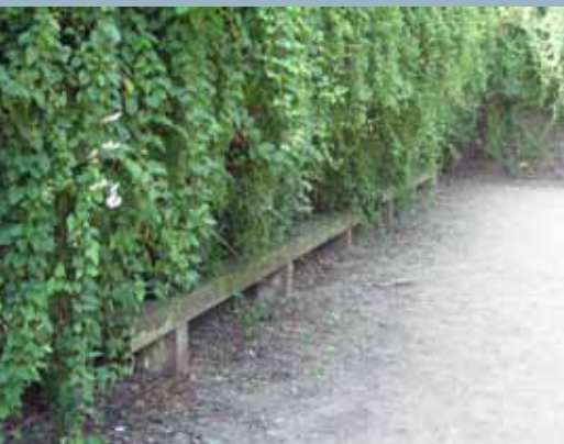
Zugewachsene, marode Sitzgelegenheit.