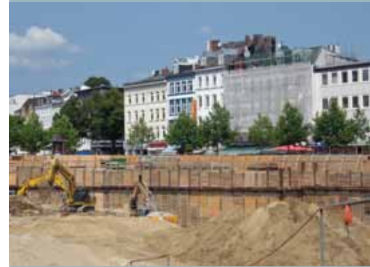
Blick in die Baugrube an der Großen Bergstraße.