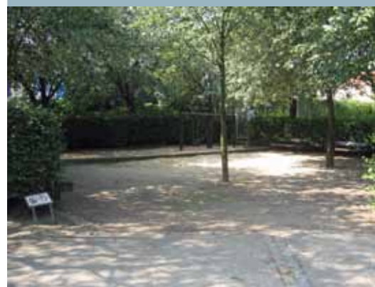
Der Kinderspielplatz an der Ecke Virchowstraße.