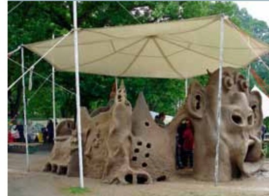
Lehmbaustelle: Sinnliches Erleben und Kreativität.

Die SAGA plant bei ihren drei Wohngebäuden zwischen Thedestraße, Billrothstraße, Unzerstraße und Balthasarweg in den nächsten zwei Jahren umfangreiche energetische Sanierungsmaßnahmen. Ein entsprechender Bauantrag wurde beim Bezirksamt bereits eingereicht. Die sechsgeschossigen Wohngebäude aus den Jahren 1960-1963 wurden im Zuge der Neu-Altona-Planung errichtet und verfügen jeweils über 36 Mietwohnungen.