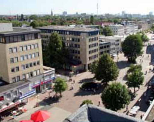
Blick auf die Neue Große Bergstraße.