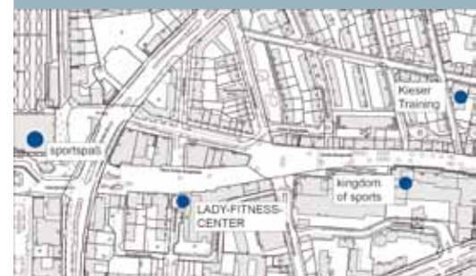
Fitness-Studios am Gesundheitsstandort Große Bergstraße.