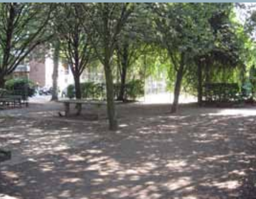
Die Freizeitfläche an der Ecke Hospitalstraße.

Grundlegende Veränderungen sind derzeit im zentralen Baublock im Sanierungsgebiet, eingegrenzt durch die Hospital- und Virchowstraße sowie die Große Bergstraße und die Schomburgstraße, zu beobachten. Wo bis vor einem Jahr ein Parkplatz zu finden war und südlich von diesem die Kleine Bergstraße verlief, wird derzeit ein fünfgeschossiger Gebäuderiegel errichtet. Der Altonaer Spar- und Bauverein baut hier gemeinsam mit zwei Baugemeinschaften 55 neue Wohnungen. Der Rohbau wächst täglich und man kann bereits die spätere Gebäudeform erahnen. Die Fertigstellung ist für das zweite Halbjahr 2012 geplant.