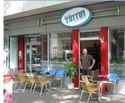
Das neue Eiscafé Tintin: Große Bergstraße 261.