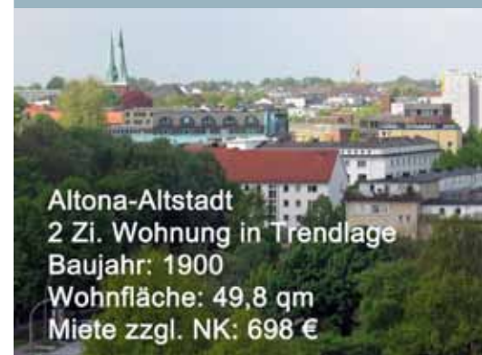
Altona-Altstadt 2 Zi. Wohnung in Trendlage Baujahr: 1900 Wohnfläche: 49,8 qm Miete zzgl. NK: 698 €