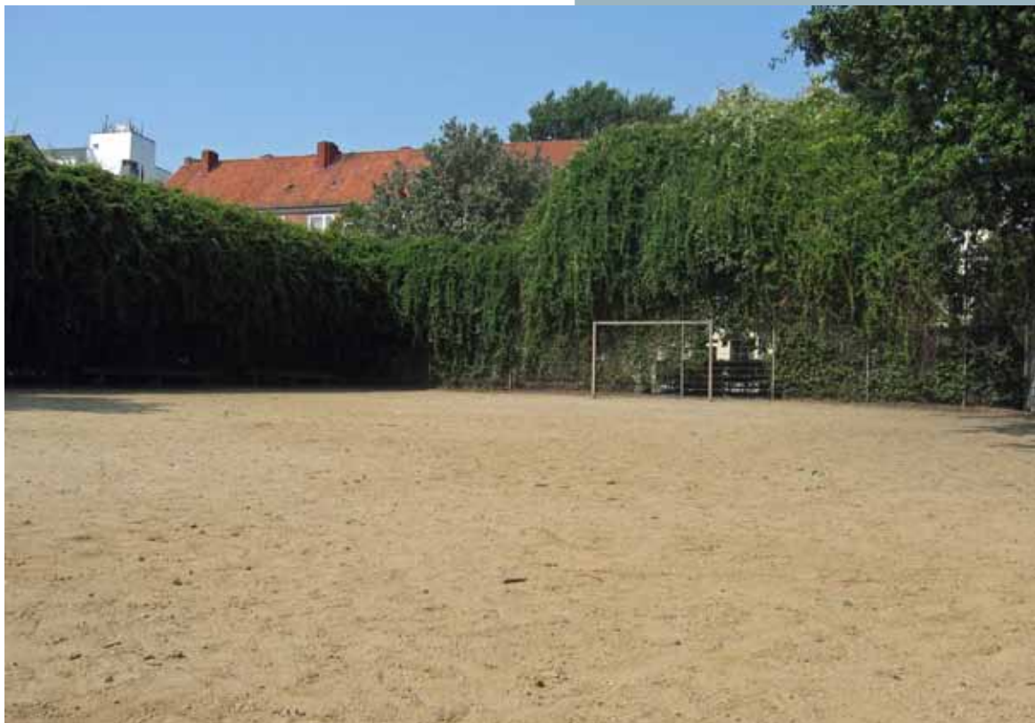
Der Bolzplatz bleibt immer häufiger ungenutzt.