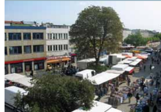
Wochenmarkt Neue Große Bergstraße: Viel mehr als Einkaufen.