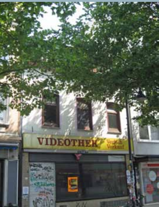
So sieht die Hausfassade heute aus.