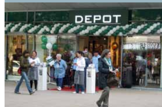
Am 10. August eröffnete das DEPOT in der Großen Bergstraße 154.