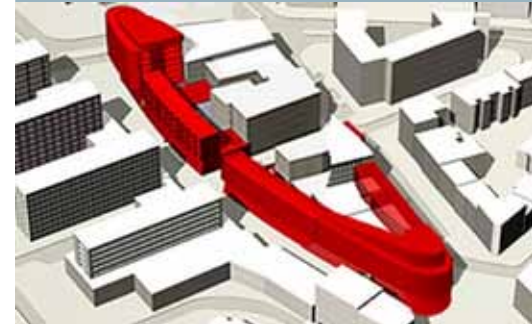
Der Bebauungsplan in 3D (urbanista.better.cities)

Dass die Situation im Bereich der Fußgängerunterführung Max-Brauer-Allee unbefriedigend ist und dringend verbessert werden muss, ist unstrittig. Auch die oberirdische Querung am Fußgängerüberweg Max-Brauer-Allee sowie die gesamte Fuß- und Radwegverbindung zwischen den beiden Zentrumsbereichen Neue Große Bergstraße und Ottenser Hauptstraße sind verbesserungsbedürftig. Ende Juni wurde deshalb ein Gutachterverfahren zur Optimierung der Fußgängerunterführung sowie der oberirdischen Fuß- und Radwegverbindungen gestartet. Das engere Wettbewerbsgebiet umfasst den Bereich zwischen McDonald´s und der Fußgängerrampe in der Neuen Großen Bergstraße. Drei Planungsbüros entwickeln hierzu bis Anfang Oktober konkrete, realisierbare Vorschläge, inklusive einer Kostenschätzung. Am 20. Oktober wird eine Wettbewerbsjury die eingereichten Arbeiten bewerten. Anschließend werden die Entwürfe in einer öffentlichen Veranstaltung vorgestellt und diskutiert. Ziel ist es, den bestmöglichen Lösungsvorschlag danach zügig zu verwirklichen.