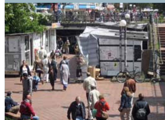
Wo geht es hier denn zur Neuen Großen Bergstraße?